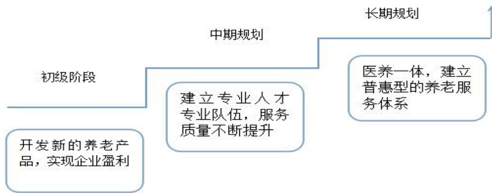
图 2 S 养老院战略开发步骤图